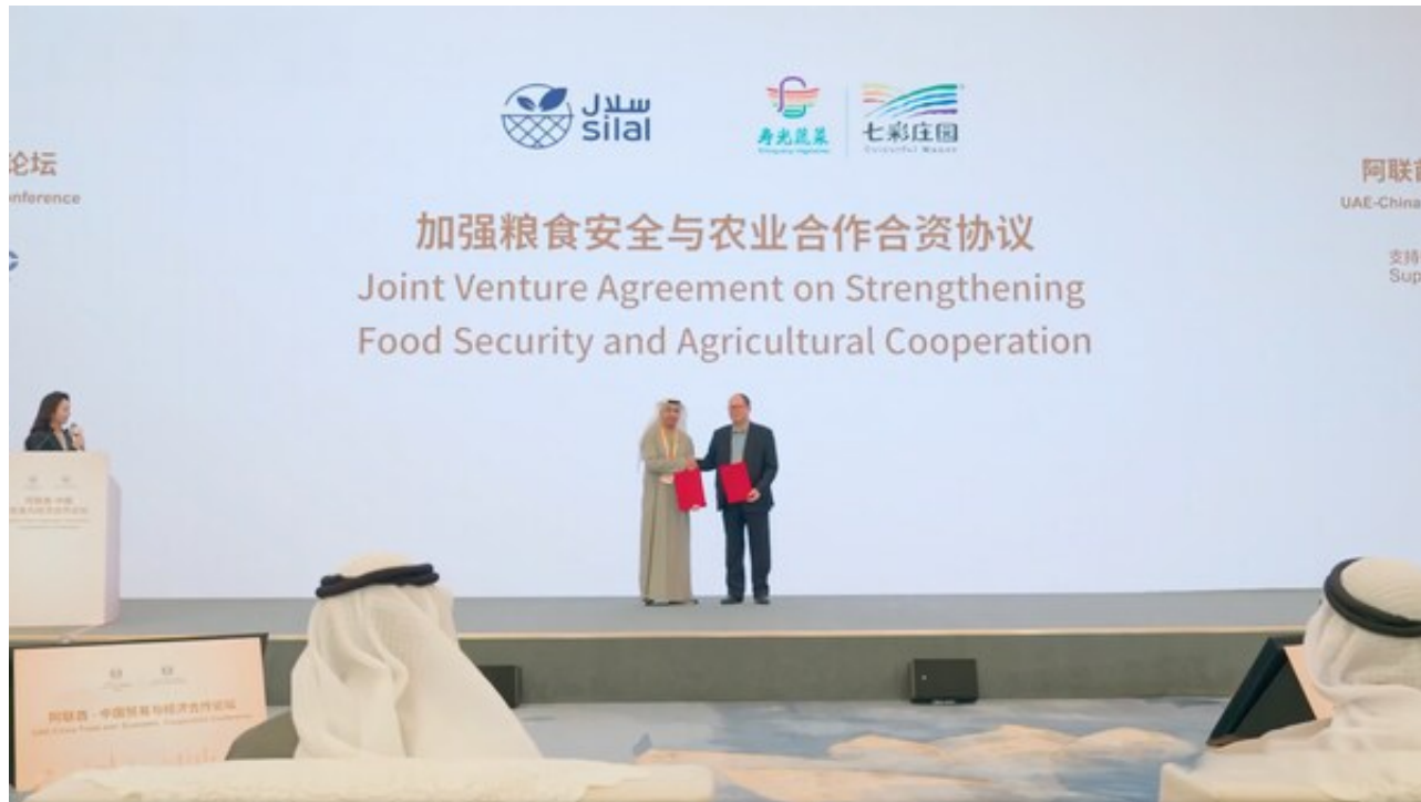
Theyab bin Mohamed bin Zayed见证Silal与SVG在2025年中国国际进口博览会上签署合资协议

原文地址： http://www.china-nengyuan.com/news/236962.html