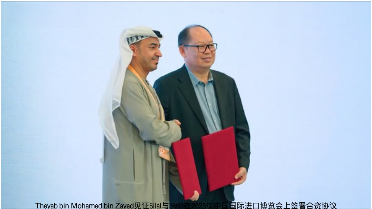
Theyab bin Mohamed bin Zayed见证Silal与SVG在2025年中国国际进口博览会上签署合资协议

2025年中国国际进口博览会（CIIE）期间，在阿联酋总统办公厅发展事务及烈士家属副主任Sheikh Theyab bin Mohamed bin Zayed Al Nahyan殿下以及阿联酋外贸部长Thani bin Ahmed Al Zeyoudi博士阁下的见证下，阿布扎比领先的农业食品和技术公司Silal与中国农业技术领军企业之一寿光七彩庄园现代农业有限公司（Shouguang Colorful Manor Modern Agriculture，以下简称SVG）签署了具有里程碑意义的合资（JV）协议。